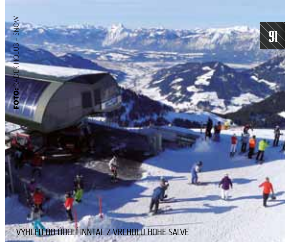
VYHLÉD DO ÚDOLÍ INNTAL Z VRCHOLU HOHE SALVE